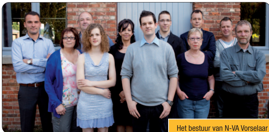
Het bestuur van N-VA Vorselaar