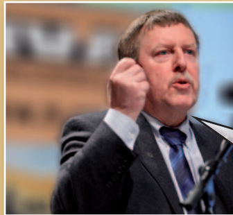
Siegfried Bracke N-VA-Kamerlid

“Ik stel keer op keer vast dat het onderscheid tussen CD&V, Open Vld en sp.a gewoon verdwijnt. Het zijn drie partijen die samen - en warmpjes - in het apparaat zitten. Kijk naar het debat over de gas- en elektriciteitsprijzen. Plots roept men energienetbeheerder Eandis uit tot vijand nummer 1. Laat me niet lachen. Wie bestuurt Eandis? Dat zijn 8 CD&V'ers, 4 sp.a'ers en 4 Open Vld'ers. Ook in die zin is de N-VA vandaag dé uitdager van het systeem.”