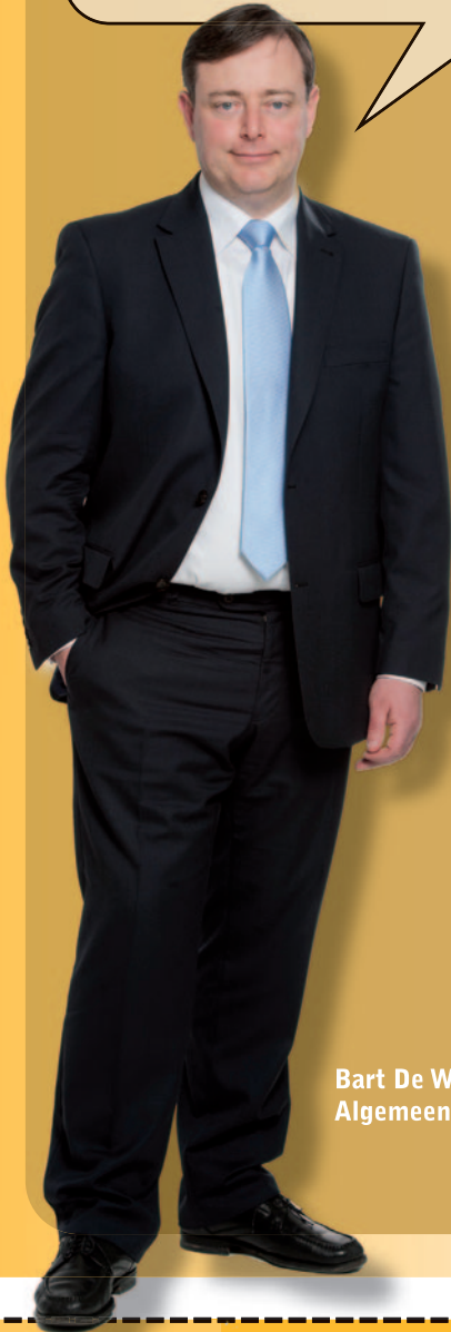
Bart De Wever Algemeen voorzitter N-VA

De N-VA kiest resoluut voor verandering. En ik vraag ook u om, samen met ons, die keuze te maken. Wil u de regering-Di Rupo weg, stem dan op 14 oktober op de N-VA!