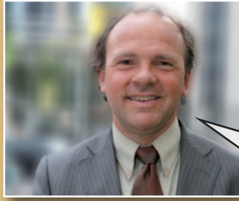
Philippe Muylers Vlaams minister van Financiën en Begroting

“Het Dexia-dossier hangt dit land als een molensteen om de hals. Als het verder fout gaat, stijgt de Belgische staatsschuld gigantisch. Ik vind dit gewoon hallucinant. De onbeantwoorde vragen stapelen zich ondertussen op. Maar Di Rupo zag geen beletsel om de Dexia-bestuurders kwijting te verlenen. Enkel het duidelijke ‘neen’ van de Vlaamse Regering deed de Belgische stem nog naar een ‘onthouding’ schuiven. Niet te begrijpen.”