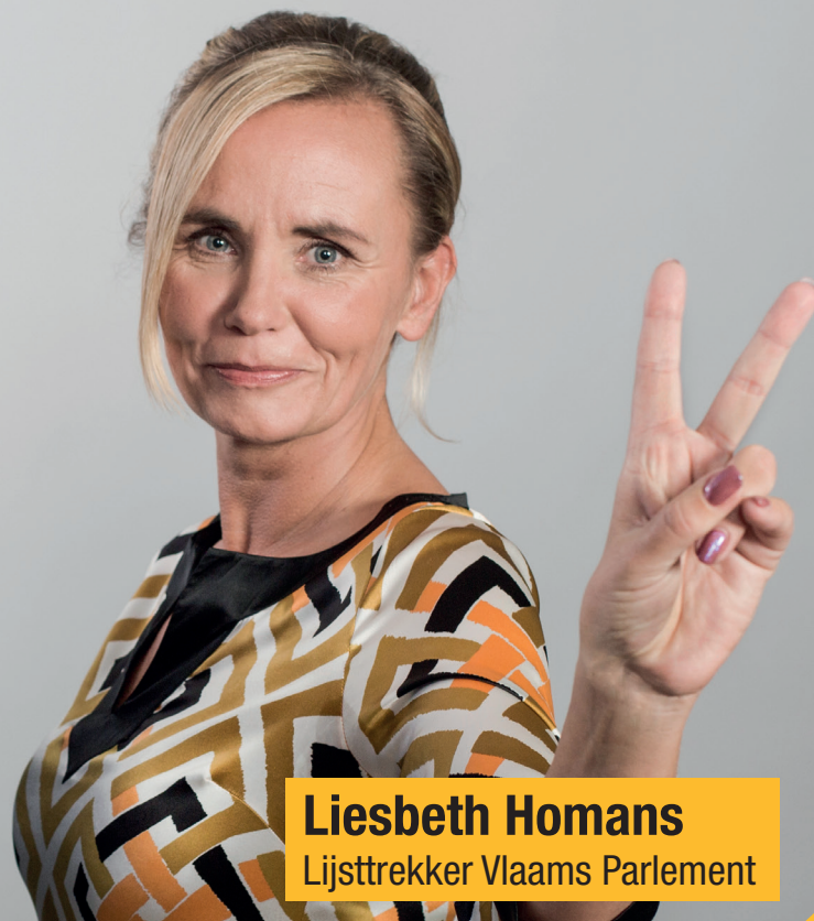
Liesbeth Homans Lijsttrekker Vlaams Parlement

Als burger, als vader en als burgervader zoek ik elke dag oplossingen voor het welzijn van iedereen die werkt, spaart en onderneemt. Maar zolang we België niet hervormen, staan we machteloos tegenover de hoge belastingen, de faillissementengolf, de verkwistende structuren.