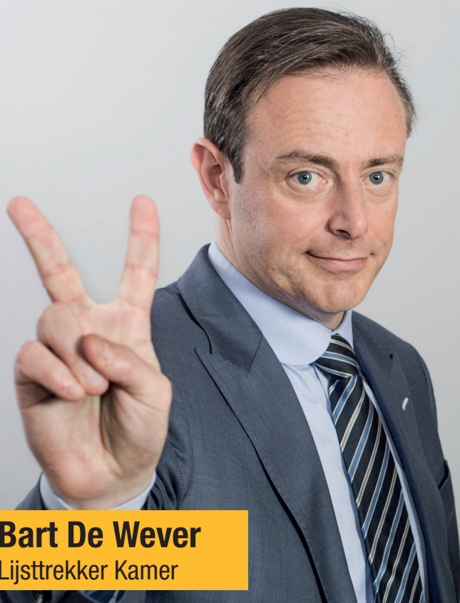
Bart De Wever Lijsttrekker Kamer