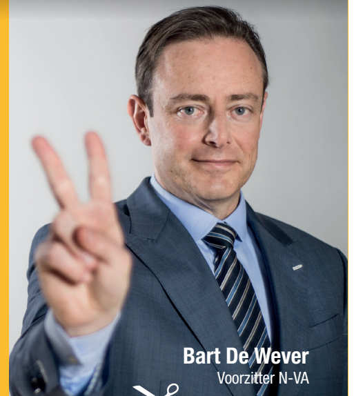
Bart De Wever Voorzitter N-VA