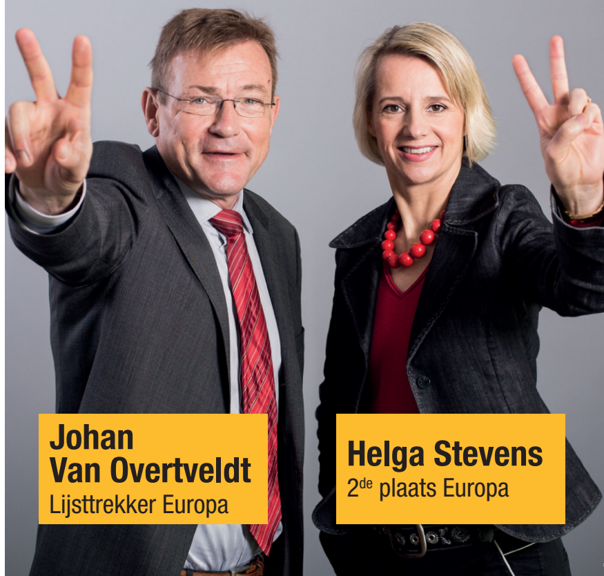
Johan Van Overtveldt Lijsttrekker Europa

De N-VA wil dat de verschillende landen van de EU hun identiteit kunnen bewaren. De EU moet niet over alles beslissen. Een Verenigde Staten van Europa, een Europese superstaat, is dus géén goed idee. De Unie moet groeien van onderuit en mag niet van bovenaf worden opgelegd.